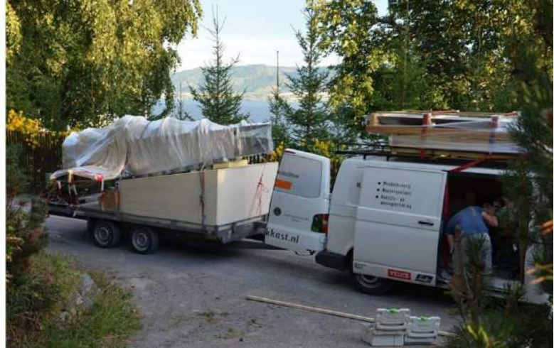
Opladen en inpakken

In de avond was er nog een gezellige familiebijeenkomst waar we wederom werden verwend, dit keer met een Noorse snack bestaande uit een enorme schaal gamba's met een saus, Noors brood en natuurlijk een bijpassende witte wijn.