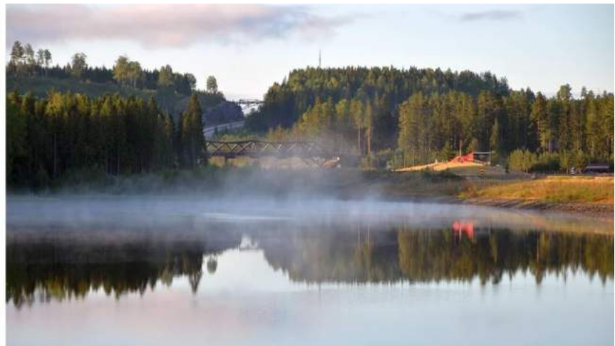
Sleutelen bij zonsopgang

Daar hebben we ook de versnelling kunnen repareren. Er bleek een moer los te zitten die weer is vastgezet. Verder hebben we zeker een halfuur lang foto's gemaakt van deze prachtige plaats aan een meer want Noorwegen is een wonderschoon land. De hond Sacha had het hier ook wel naar z'n zin.