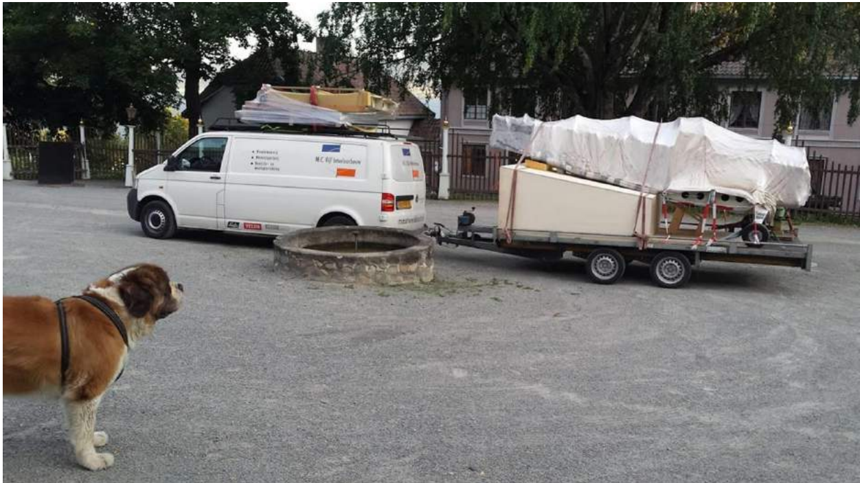
Klaar voor de terugreis

Het weer bleek inmiddels veranderd, het was koeler met een miezer buitje. Onze eerste stop was de Noors-Zweedse grens waar we onze invoerdocumenten moesten laten stempelen. Door een speciaal zinnetje op het exportdocument konden we voorkomen dat er invoerrechten moesten worden betaald. Na een uur wachten in een lange rij van vrachtwagenchauffeurs hadden we eindelijk het stempel te pakken en konden we doorrijden. Volgens de douane hadden we er goed aan gedaan om de documenten te laten stempelen want dat was toch echt nodig. Terwijl onze expediteur had beweerd dat dit niet nodig was.