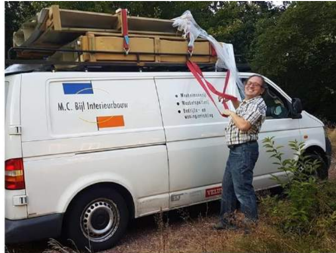
Uitladen in Naarden

's Avonds hebben we de aanhanger gelost bij een oude manege in Naarden, waar ik tijdelijk mijn project mocht opslaan totdat ik mijn garage heb vrijgemaakt als werkplaats. Het toestel moest gekanteld naar binnen want de deuropening bleek niet breed genoeg. Het lossen kostte ongeveer een kwartier en vervolgens zijn we nog 1,5 uur bezig geweest om de aanhanger en de auto weer boven te krijgen want het bospad was dermate slecht dat bus en aanhanger binnen een mum van tijd tot de assen in de zachte bosgrond waren gezakt. Met dikke spanbanden hebben we een takel geconstrueerd die was bevestigd aan de omringende bomen en eindelijk stonden we weer boven. Op het zelfde moment kwam de eigenaar thuis die een verwoest pad aantrof dat we met vereende krachten meteen weer hebben gemodelleerd.