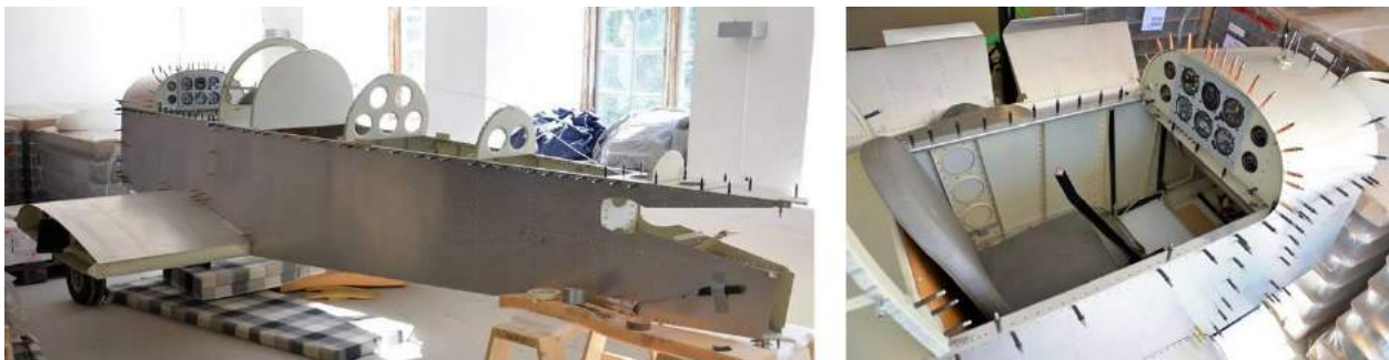
De half afgebouwde Zenair

Eind vorig jaar kwam er een Noors project in beeld van een kistje dat nog niet afgebouwd was maar wel binnen mijn financiële bereik lag. Zoals gebruikelijk ontstond er een mailwisseling en werden wat telefoontjes gepleegd om uit te vinden of het iets voor me zou kunnen zijn. Het betrof een Zenair CH100 eenzitter, compleet met motor en in een redelijk ver gevorderd bouwstadium. De communicatie kwam moeilijk op gang want het project was door de eigenaar uit handen gegeven aan een zaakwaarnemer. Deze was lastig bereikbaar en hij verwees steeds weer terug naar de eigenaar, die slecht Engels sprak. Enfin, begin januari j.l. kwam het uiteindelijk tot een bezoek.