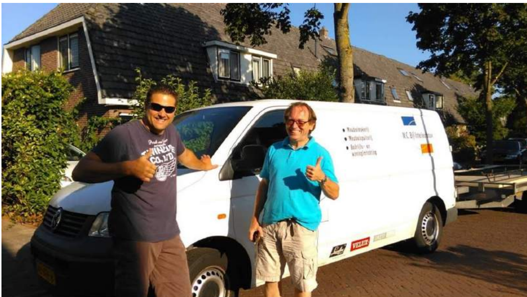
We zijn er klaar voor